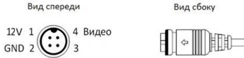
Рисунок 2 – Авиационный разъём подключения камеры

Авиационный разъём подключения камеры изображен на рисунке 2.