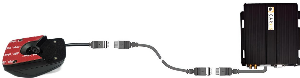
Рисунок 4 – Подключение камеры к автомобильному регистратору CARVIS (с помощью удлинительного кабеля)