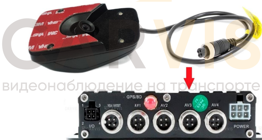
Рисунок 3 – Подключение камеры к автомобильному регистратору CARVIS (прямое подключение)

Примечание – Изображение камеры/монитора/регистратора может не совпадать с изображением, приведённым в инструкции.